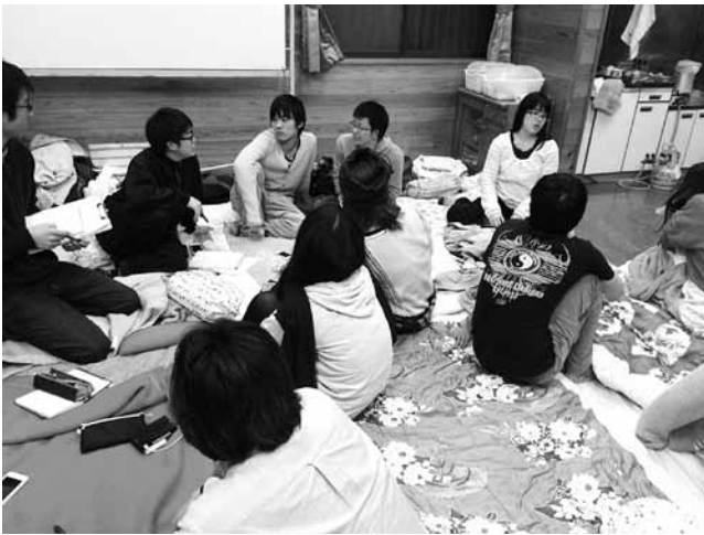
筆者が代表をつとめる、NPO こばていが実行委員会形式で開催・参画する、子どもフェスティバル企画合宿の様子