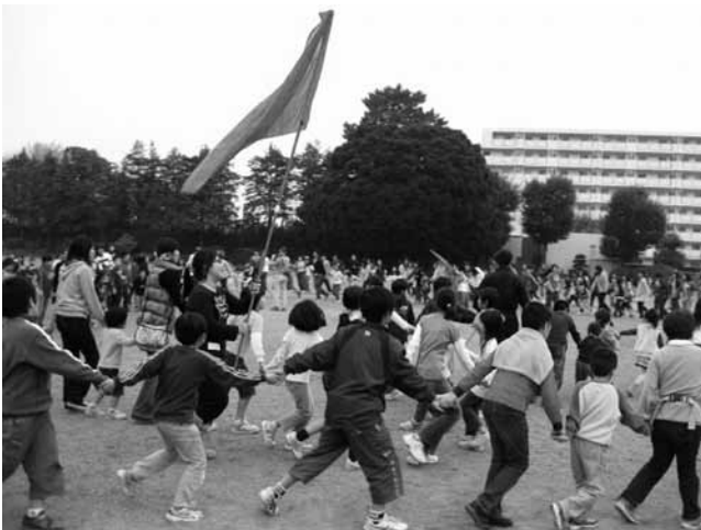
子どもフェスティバル当日の様子